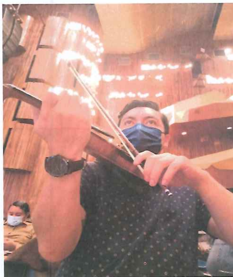
Práctica seccional de los arpeggios del numeral 2, acto I.