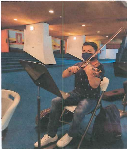
Ensayo del acto II de la "Ópera El Pueblo K'iché"