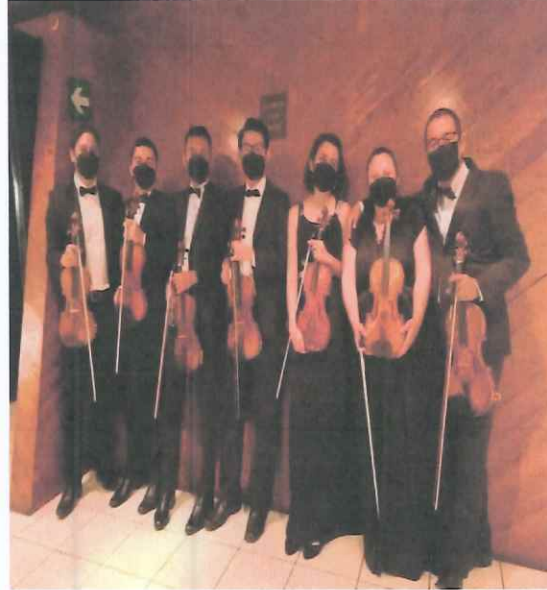
Sección de violines I, durante el receso del primer acto de la ópera "Pueblo Quiché"