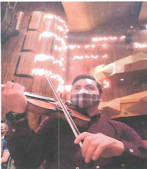
Ensayo del acto III de la ópera "K'iché Winaq"

Se trabajó con los solistas las entradas del dúo del martirio y las indicaciones de los cambios de tempo en las frases cantadas.