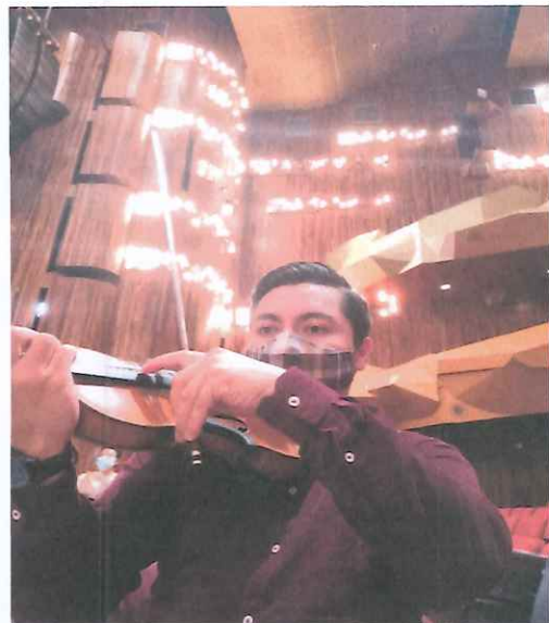
Práctica de las indicaciones de las dinámicas propuestas por el director.