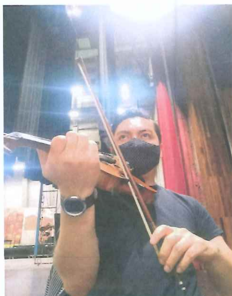
Ejecución del numeral 2 del primer acto de la ópera “K’iché Winaq”

Se dio énfasis al primer acto de la ópera por el ensamble con el coro, teniendo un tiempo especial de estudio para la sección de cuerdas asegurando la ejecución del fraseo que implica dicho acto.