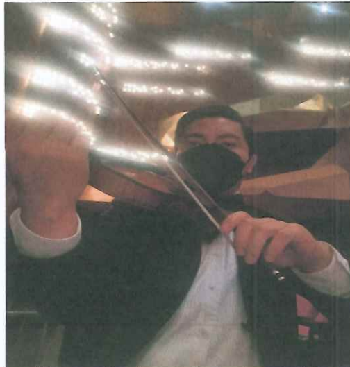
Grabación audiovisual de la ópera "Pueblo Quiché"

La grabación se realizó de forma continua y luego por actos. Se repitieron varias escenas para una mejor toma de video con los diferentes grupos artísticos, el ballet, coro, solistas y orquesta.