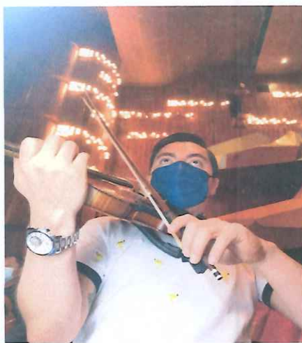
Ensayo completo de la ópera "K'iché Winaq"

Se ejecutó la ópera completa sin interrupción para marcar los tiempos con el ballet, el coro y los solistas. Hubo correcciones de tiempo en algunos numerales como la Danza de los Tesoros Escondidos.