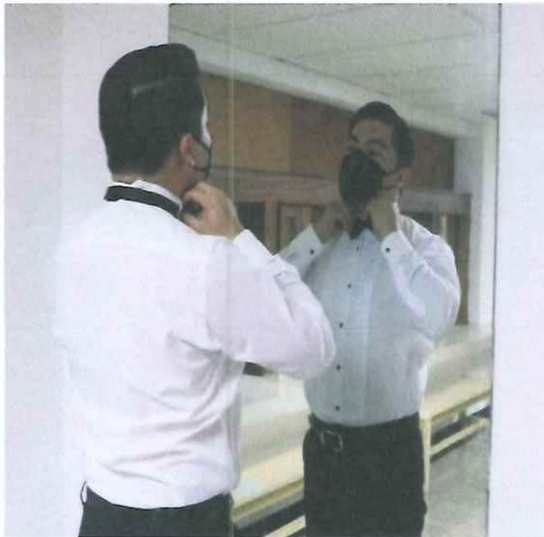
Fotografía tomada por el MCD en los camerinos de artistas, previo a la función de la ópera "Pueblo Quiché"

Se realizó la tercera presentación para todo público en la Gran Sala del Centro Cultural Miguel Ángel Asturias, participando el ballet, coro, solistas y orquesta Filarmónica Libertad.