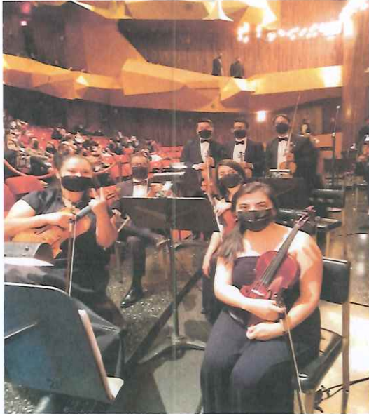
Sección de violines I, previo a iniciar la ópera "Pueblo Quiché"

Se realizó la segunda presentación para todo público en la Gran Sala del Centro Cultural Miguel Ángel Asturias, participando el ballet, coro, solistas y orquesta Filarmónica Libertad.