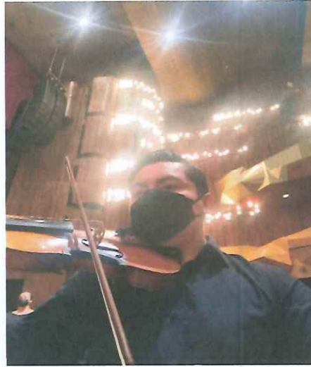
Estudio de las dinámicas del acto 3, numeral 25