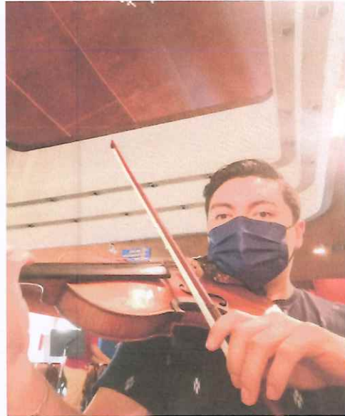
Práctica de las indicaciones de las dinámicas propuestas por el director.

Enlace de video del ensayo efectuado el 30 de septiembre de 2021: