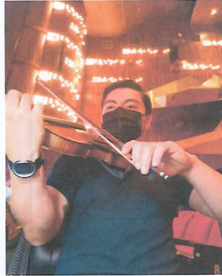
Ensayo general, acto II