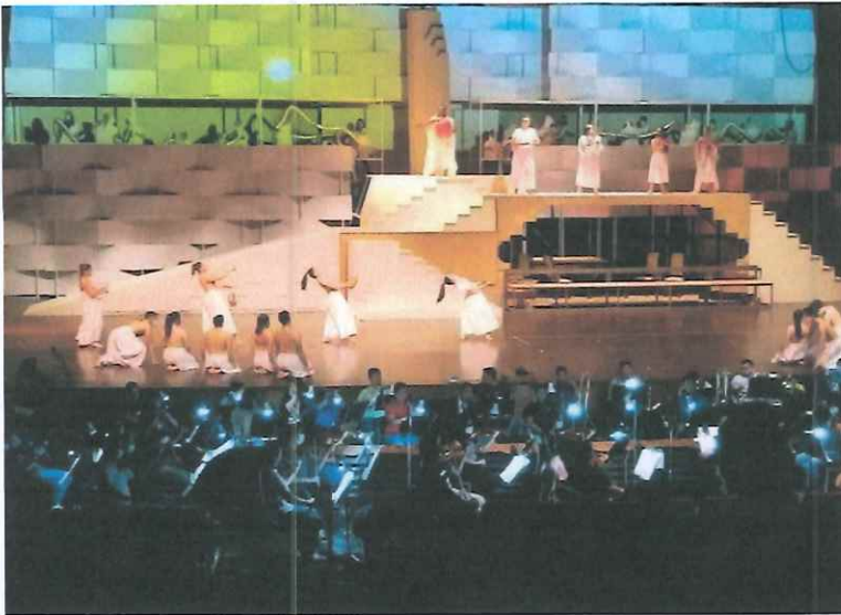
Ensayo general, acto I

En este ensayo se ejecutó la ópera, sin interrupciones y de forma continua tomando los tiempos entre cada acto para la presentación final, control de luces, sonido, vestuario y espacio para el desarrollo de la ópera.