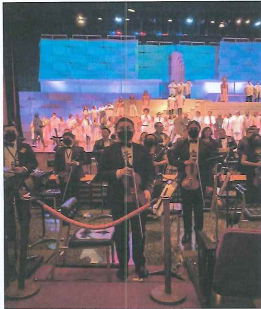
Saludo final de la presentación de la ópera "Pueblo Quiché"

Se realizó la última presentación para todo público en la Gran Sala del Centro Cultural Miguel Ángel Asturias, participando el ballet, coro, solistas y orquesta Filarmónica Libertad.