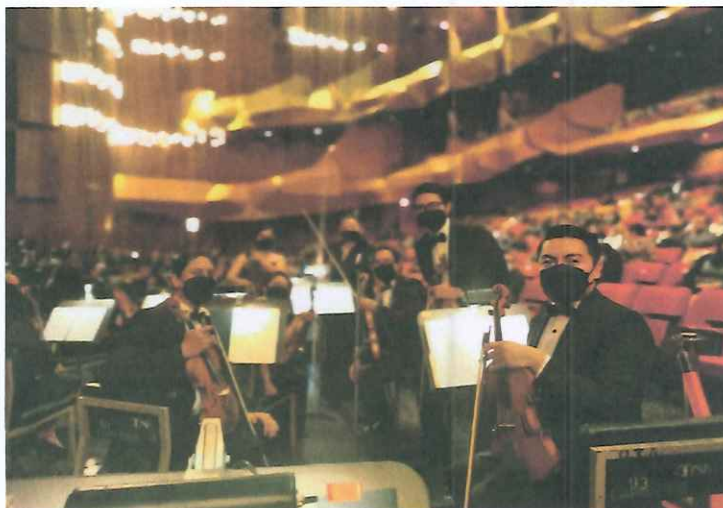
Primer concierto para público en general de la ópera "Pueblo Quiché"

Se realizó la primera presentación para todo público en la Gran Sala del Centro Cultural Miguel Ángel Asturias, participando el ballet, coro, solistas y orquesta Filarmónica Libertad.