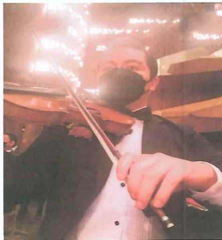
Primer concierto de la ópera "Pueblo Quiché"

Se realizó la primera presentación privada para los administradores públicos, funcionarios, diplomáticos e invitados especiales en la Gran Sala del Centro Cultural Miguel Ángel Asturias.